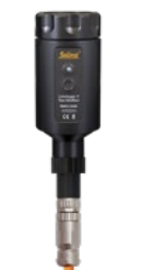
Tête de puits LevelVent 5