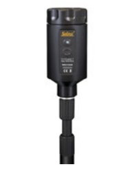
Adaptateur de lecture directe à signal optique