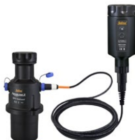
Tête de puits AquaVent 5 et câble de connexion de l'App

Connexion à un câble de lecture directe ou de connexion, à un adaptateur ou à une tête de puits