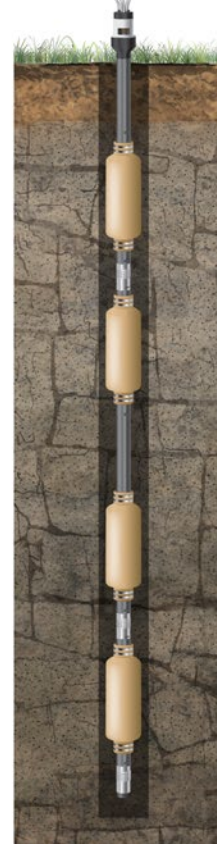
Hasta 24 zonas de monitoreo