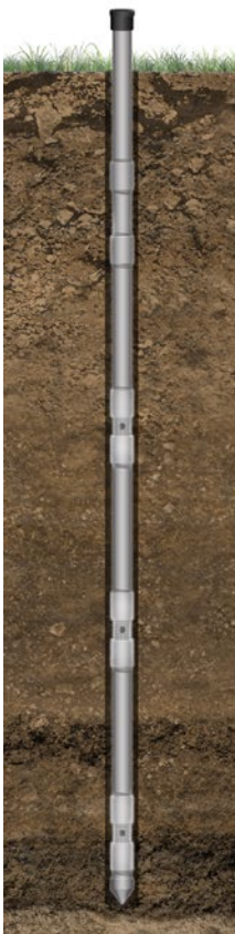
Hasta 6 zonas de monitoreo

Desde principios de la década de 1980, Solinst ha estado trabajando con expertos en el campo de la hidrogeología para desarrollar sistemas de monitoreo de aguas subterráneas, que proporcionan los datos del subsuelo de alta resolución que exigen las investigaciones precisas del subsuelo. Solinst fabrica tres tipos diferentes de sistemas multinivel, cada uno adecuado para diferentes entornos y aplicaciones.