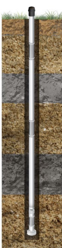
Hasta 7 zonas de monitoreo