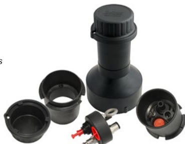
Tapa-pozos para Bombas Dedicadas

La Bomba DVP is ideal para aplicaciones de muestreo de bajo flujo y muestreo de flujo normal. La bomba de acero inoxidable puede operar a profundidades hasta de 150 metros.