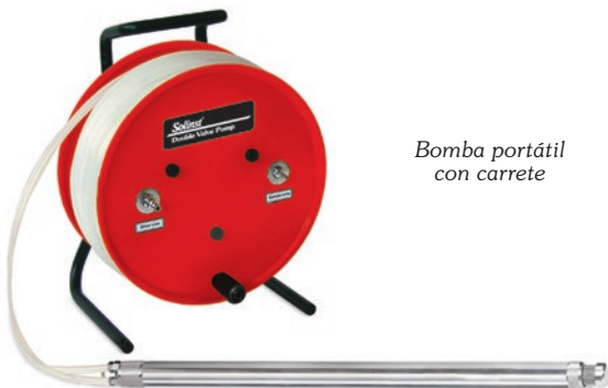
Bomba portátil con carrete

Para realizar muestreos de menor frecuencia, ofrecemos sistemas portátiles con carrete para permitir el acceso a múltiples pozos de monitoreo, aún en sitios remotos. El carrete tiene manija y se sostiene por sí mismo. El sistema se puede suministrar para casi cualquier aplicación independientemente del tamaño o profundidad de la misma.