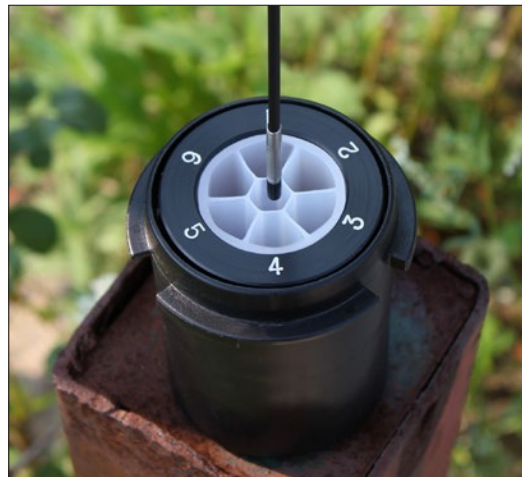
Mediciones hechas a través de los canales angostos del sistema Multicanal CMT de Solinst.

El medidor Mini se ofrece en longitud única de 25 m o 80 pies Se puede suministrar con las sondas P4 o P10.